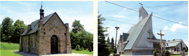
Kaplica w Lewinowie (fot. UG), Kościół w Lewinowie (fot. UG)