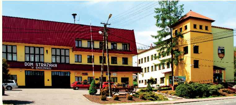
Budynek Urzędu Gminy i Domu Strażaka w Gnojniku

* Urząd pocztowy w Gnojniku, tel. 14 664 82 48, 14 661 10 01