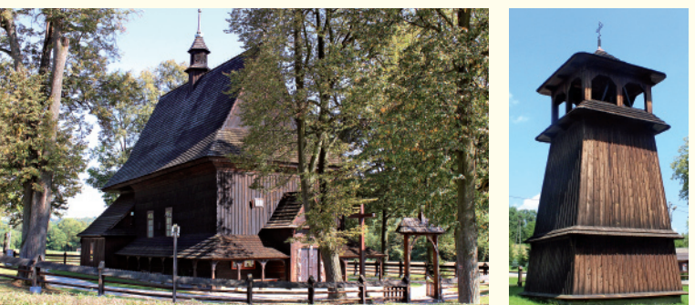
Kościół pw. św. Urszuli w Gosprzydowej (fot. UG), Drewniana dzwonnica (fot. UG)

Drugim zabytkiem na Szlaku Architektury Drewnianej jest Kościół parafialny pw. św. Urszuli z 1697 r. w Gosprzydowej. Charakterystycznymi elementami zewnętrznymi świątyni są smukła wieżyczka na sygnaturkę oraz otwarte sobótki, będące w dawnych czasach schronieniem dla wędrych, którzy przychodzili z odległych przysiódków. Ściany wewnątrz zdobione są polichromią z XIX w. Wśród wielu historycznych elementów wyposażenia gosprzydowskiej świątyni odnotować należy barokowy ołtarz główny, w którym znajdują się dwa nalożone na siebie obrazy. Jeden – zasłaniający przypomina obraz Matki Boskiej Częstochowy.