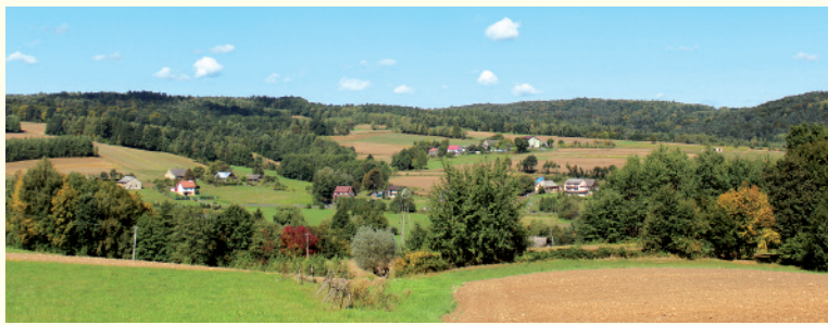
Panorama Gosprzydowej

Piękne i bogato ukształtowane tereny zwiedzać można zarówno pieszo, jak i samochodem. Dzięki odnowionym drogom i powstałym ścieżkom przyjemnie podróżuje się między wioskami również rowerem. Niezależnie od środka lokomocji zabytki gminy warto zwiedzać z oczyma szeroko otwartymi. Piękno gnojnickich skarbów architektury i natury zachwyca każdym swym najdrobniejszym elementem.