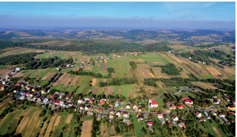
Panorama miejscowości Biesiadki z lotu ptaka

O niezwykłym uroku Biesiadek decyduje szerogowa, drewniana zabudowa w centrum wsi usytuowana wzdłuż drogi biegnącej gniań wzniesienia. Zabudowa powstała po pożarze w 1933 roku, który spowodował zniszczenie większości wcześniejszych osiemnasto- i dziewiętnastowiecznych drewnianych budynków. Charakterystycznym elementem drewnianych budynków są okna z ozdobnymi wycinanymi obramowaniami oraz malowane ściany dekorowane wycinanymi we wzory deseczkami.