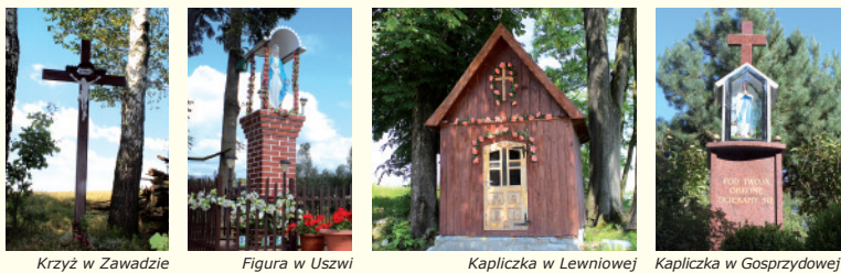
Krzyż w Zawadzcie, Figura w Uszwi, Kapliczka w Lewinowie, Kapliczka w Gosprzydowej

Kapliczki, figury i krzyże Przejeżdżając przez sołectwa Gminy nie trudno nie zauważyć rozsianskich po całym terenie przyrodniczych kapliczek, figur oraz krzyży. Stawiane są z wdzięczności za otrzymane łaski, za wysłuchanie prośb, bądź jako ofara dziękczynna za wybaczenie z niebezpieczeństwa lub wyleczenie z choroby. Wtopione w krajobraz gnojnickich wsi, w otoczeniu przyrody widnieją niczym drogocenne kamienie na trudnych ścieżkach życia.