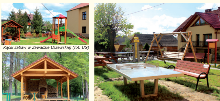
Kącki zabaw w Zawadzcie Uszewskiej (fot. UG), Altana z grillem w centrum Gnojnika (fot. UG), Kącki zabaw w miejscowości Biesiadki (fot. UG)

Również w Biesiadkach, Gosprzydowej oraz Zawadzcie Uszewskiej mieszkańcy i turyści mogą skorzystać z kolorowych i bezpiecznych kątek rekreacyjno-turystycznych.