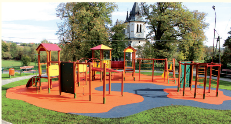
Plac zabaw w Gnojniku

Plac zabaw „Radosna Szkoła” sprawiła, że w centrum Gnojnika jest kolorowo i radośnie. Plac jest idealnym miejscem dla Rodzin - pokryty bezpieczną, nawierniczną zaprasza wszystkie dzieci do zabawy na huśtawce, bieżce czy koniku polnym.oko placu znajduje się altana z grillem – miejsce spotkań młodzieży oraz dorosłych mieszkańców.