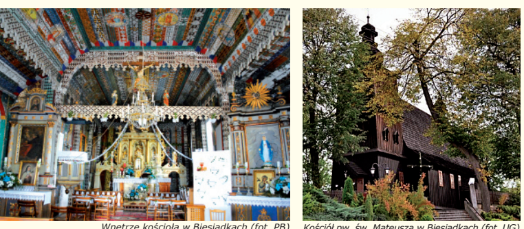
Wnętrze kościoła w Biesiadkach, Kościół pw. św. Mateusza w Biesiadkach

Wędrując przez Małopolskę Szlakiem Architektury Drewnianej dotrzeć możemy do położonego w Biesiadkach Kościoła parafialnego pw. św. Mateusza Ewangelisty z II połowy XVIII wieku. Charakterystycznymi elementami zewnętrznymi modrzewiowej świątyni są trzy kondygnacyjna wieża z wnękami, w których umieszczono rzeźby świętych, baniasty hełm wieży z latarnią oraz portal ostrołukowy wraz z drzwiami wejściowymi z pięknymi, starymi okuciami. We wnętrzu kościoła zachwyca polichromia z 1938 r., ołtarz główny barokowy z około XVII w. z późnogotycką rzeźbą Piety oraz dwa barokowe ołtarze boczne (z obrazem Najświętszej Maryi Panny ze świętymi oraz Matki Boskiej). Na uwagę zasługuje obraz Matki Boskiej Bocheńskiej z Dzieciątkiem z 1644 r. oraz obraz św. Rozalii, który został sprawiony do świątyni w 1676 r., aby chronić mieszkańców przed zarazą. Do obrazu pielgrzymowali mieszkańcy okolicznych wsi, prosząc o uzdrowienie. Inne zabytkowe elementy wystrój to m.in. drewniana chrzcielnica z I poł. XIX w. oraz rokokowe tabernakulum z II połowy XVIII w. Kościółowi w Biesiadkach towarzyszy zabytkowy murowany dom zarządcy.