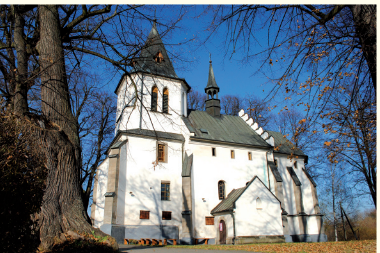
Kościół pw. św. Marcina w Gnojniku

to jeden z najstarszych zachowanych w całości zabytków murowanej architektury sakralnej we wschodniej Małopolsce. Budowla wzniesiona została z kamienia w stylu gotyckim. Charakterystycznymi cechami architektonicznymi kościoła decydującymi o jego funkcjach obronnych są: dwumetrowej grubości ściany, potężne szkarpy podpierające mury oraz rząd wąskich otworów strzelniczych. We wnętrzu kościoła spotkać można wiele zabytkowych elementów m.in. gotyckie tabernakulum, szafkę na oleje, kamienną mensę (wszystkie z XIV wieku), gotycki lawater, gotyckie portale. We wnętrzu dominują elementy z XVIII i XIX wieku: ołtarz główny rokokowy Matki Bożej Częstochowskiej, dwa ołtarze boczne rokokowe poświęcone Matce Bożej Różańcowej i św. Józefowi, barokowa chrzcielnica, rokokowa ambona, dwa drewniane konfesjonały, organy z 1854 roku oraz późnobarokowy krucyfiks. Obchodząc świątynię dookoła podziwiać można stażce drogi krzyżowej umieszczone we wnękach ścian i zamknięte drewnianymi drzwiczkami oraz Ogórcę z kamienną figurą kłęzącego Jezusa.