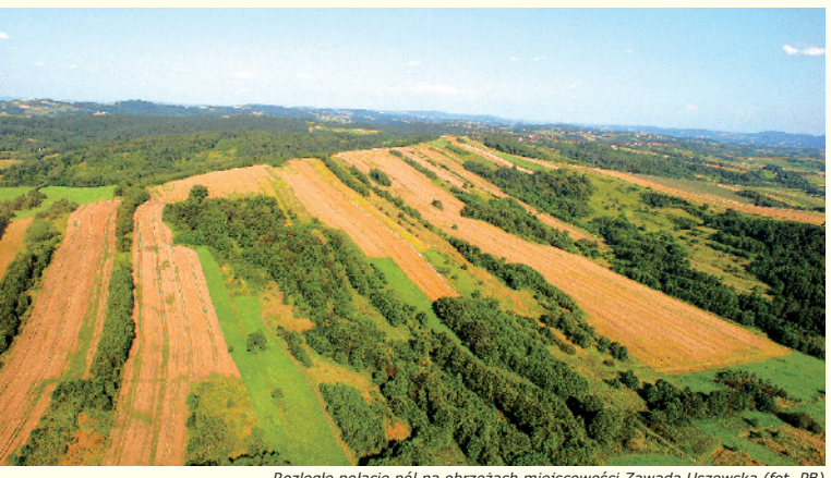
Rozległe polacie pól na obrzeżach miejscowości Zawada Uszewska