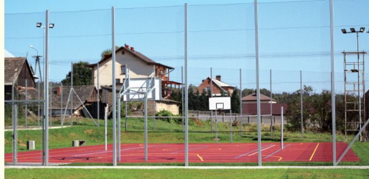
Orlik w Uszwi

OBIEKTY SPORTOWE Natomість amatorów sportu czekają w Gminie Gnojnik nowoczesne i dobrze wyposażone obiekty sportowe. Z pliku stadionów sportowych (w Gnojniku, Gosprzydowej, Lewinowie, Uszwi i Żerkowie) korzystać mogą nie tylko mieszkańcy, ale również turyści odwiedzający naszą gminę. Szczególnie bogata oferta zajęć sportowych czeka na użytkowników Orlika w Uszwi, wyposażonego w boisko do piłki nożnej, koszykówki, siatkówki, piłki ręcznej oraz tenisa ziemnego.