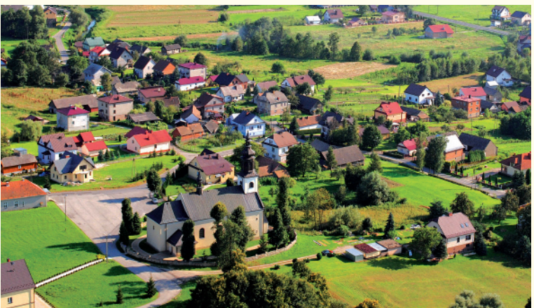
Centrum Uszwi z lotu ptaka

Kościół pw. św. Floriana z 1801 r. w Uszwi łączy styl barokowy z klasycystycznym. Ma grube mury i prostą bryłę, z którymi idealnie komponują się bogate w złożone elementy wyposażenia świątyni. Kościół posiada duży chór muzyczny podparty dwoma masywnymi filarami. Charakterystycznymi elementami zewnętrznymi są znajdujące się prośduku dachu smukła wieżyczka na sygnaturkę oraz niewielka wieża zwieńczona baniastym hełmem z ażurową latarnią. Wnętrze zdobi polichromia figuralna: barokowo-klasycystyczny ołtarz główny z obrazem św. Floriana i Ukrzyżowania oraz czterema postaciami objawiającymi Cnoty Kardynałne. Cennyimi dziełami są także trzy ołtarze boczne oraz rokokowa ambona z rzeźbą Chrystusa Dobrego Pasterza z XVIII w.