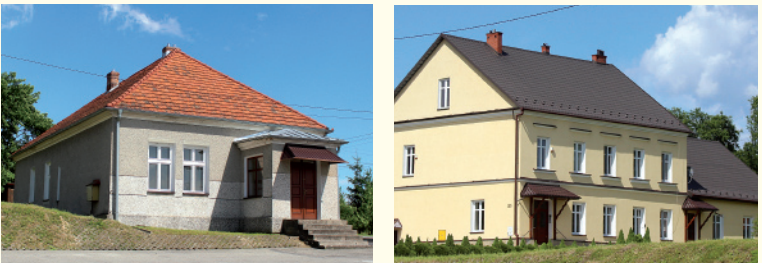
Dom Parafialny przy kościele w Uszwi (fot. UG), Plebania w Uszwi (fot. UG)

W sąsiedztwie kościoła znajdują się: plebania z 1869 r. będąca dawniej budynkiem mieszkalnym dworu należącego do Jana Goetza – Okocimskiego; dom parafialny wzniesiony w 1860 r. pełniący pierwotnie funkcję szkoły parafialnej.