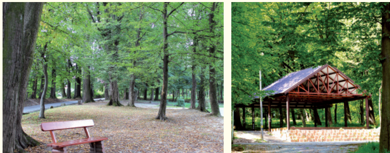
Amfitheater w parku w Gnojniku

Zielonym sercem Gminy jest Park Podworski w Gnojniku o powierzchni ok. 4 ha założony w stylu angielskim około 1845 r. Charakterystyczne elementy parku to: lipowo-jesionowe aleje i polana z dębem-romantycznym samotnikiem. Wśród zasadzonych drzew spotkać można dęby, graby, kasztanowce, lipy, brzozy, topole, sosny, modrzewie. Obecnie w parku mieszczą się drożki spacerowe oraz laweczki, dzięki czemu jest to miejsce idealne na chwilę relaksu i wyciszenia.