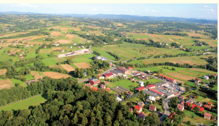
Centrum Gnojnika z lotu ptaka

Klimat gminy Gnojnik tworzy drewniana architektura sakralna i użytkowa, będąca świadkiem minionych wieków: kościół pw. św. Mateusza w Biesiadkach, kościół pw. św. Urszuli w Gosprzydowej oraz liczne stare wiejskie chałupy i budynki gospodarcze rozsiane po całej okolicy. Naturalnie piękno drewnianych budowli, dodatkowo uobocane przez wieki ogromnym nakładem pracy mieszkańców, zachwyca każdego obserwatora.