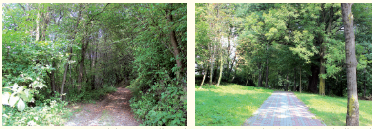
Las Grabaliny w Uszwi (fot. UG), Park podworski w Gnojniku (fot. UG)

Pomimo zwiększającego się zurbanizowania gminy Gnojnik znaczną część jej terenów pokrywają elementy naturalne. Dominantę krajobrazową stanowią pagórkę pokryte leśną gęstwiną lub przybrane w szachownicę pól. Wysoczyzna przeorana jest licznymi wawozami, jarami i zalesionymi gaikami. Spacer po tak ukształtowanym terenie jest fascynującą przygodą, nigdy bowiem nie wiemy, jaki krajobraz ujrzemy stawiając kolejny krok, mijając kolejne wzniesienie.