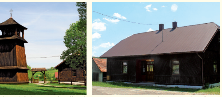
Plac przy kościele w Gosprzydowej, Dom parafialny w Gosprzydowej

skiej, drugi – zasłaniający stanowi kopię obrazu Matki Boskiej Bocheńskiej, do której licznie pielgrzymują wierni spoza parafii. Ponadto w świątyni zachowały ołtarze boczne: ołtarz Jezusa Ukrzyżowanego, ołtarz Serca Jezusowego oraz ołtarz Grobu Bożego. Wystroju wnętrza dopełnia XV-wieczna kamienna chrzcielnica, kropielnica z XV lub XVI w., ambona z przełomu XVII i XVIII w. oraz organy kościelne zakupione w fabryce braci Rieger na Śląsku w 1901 roku.