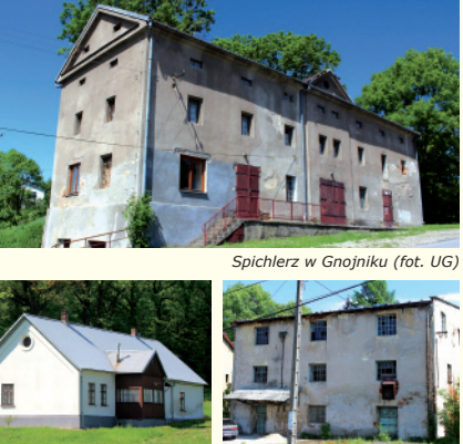
Nowy kościół w Gnojniku, Spichlerz w Gnojniku, Stara plebania, Młyn w Gnojniku