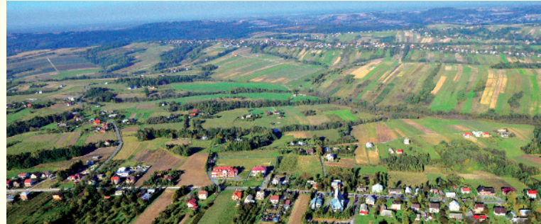
Panorama miejscowości Lewinowa z lotu ptaka

OBIEKTY SPORTOWE Natomість amatorów sportu czekają w Gminie Gnojnik nowoczesne i dobrze wyposażone obiekty sportowe. Z pliku stadionów sportowych (w Gnojniku, Gosprzydowej, Lewinowie, Uszwi i Żerkowie) korzystać mogą nie tylko mieszkańcy, ale również turyści odwiedzający naszą gminę. Szczególnie bogata oferta zajęć sportowych czeka na użytkowników Orlika w Uszwi, wyposażonego w boisko do piłki nożnej, koszykówki, siatkówki, piłki ręcznej oraz tenisa ziemnego.