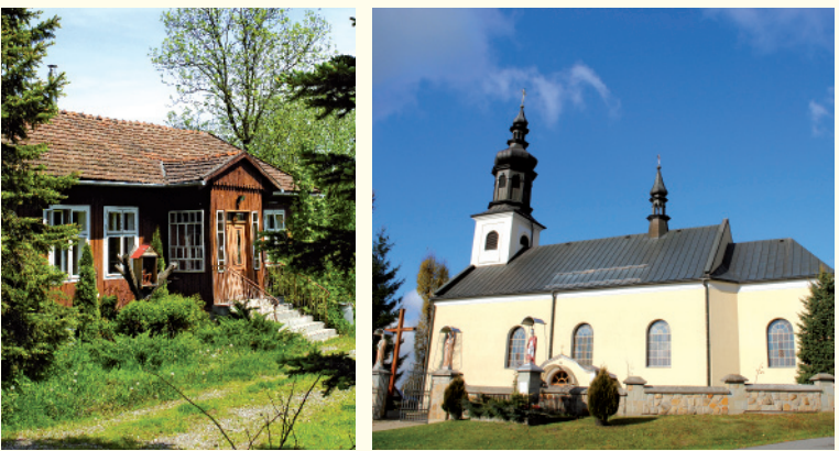
Wikardówka w Gnojniku (fot. PB), Kościół pw. św. Floriana w Uszwi (fot. PB)