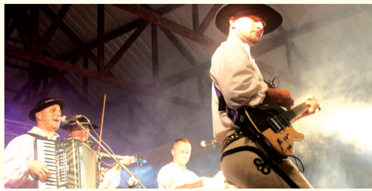
„Bacłary” na Dniach Gminy Gnojnik

OFERTA KULTURALNA Bogata oferta kulturalna Gminy Gnojnik jest owocem kultywowania folkloru i sztuki ludowej, ale również zainteresowania nowymi formami sztuki. O kontakt mieszkańców i gości Gminy Gnojnik z kulturą dba Centrum Kultury oraz działające w jego strukturach trzy biblioteki oraz sześć świetlic wiejskich. Wśród cyklicznych imprez organizowanych przez te placówki można znaleźć wiele ciekawych pozycji: styczniowe spotkania z kolegą, lutowy Międzynarodowy Turniej Szachowy o Czarnego Konia, szereg imprez w okresie wakacyjnym: powitanie lata, integracyjna spartakiada osób niepełnosprawnych, Dni Gminy Gnojnik, gminne zawody sportowe – pożarnicze, Dożynki gminne, święto pieczonego ziemniaka.